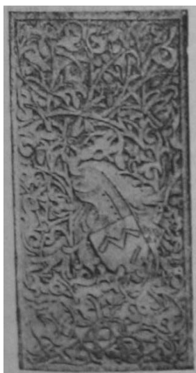
Herb na stallach w kościele w Bieczu z XV w.