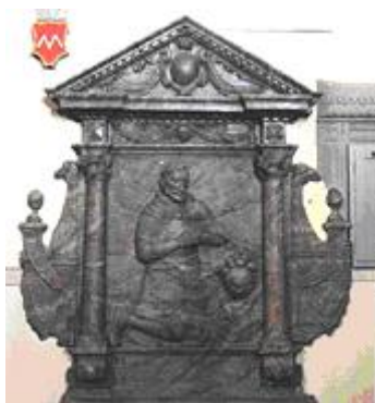
Wizerunek herbu Abdank w kościele Św. Stanisława w Chlewiskach (na północ od Kielc).